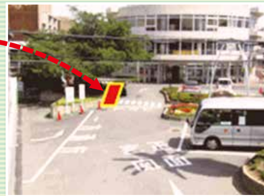
★ご理解・ご協力の程、お願い申し上げます。