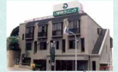
いずみクリニック